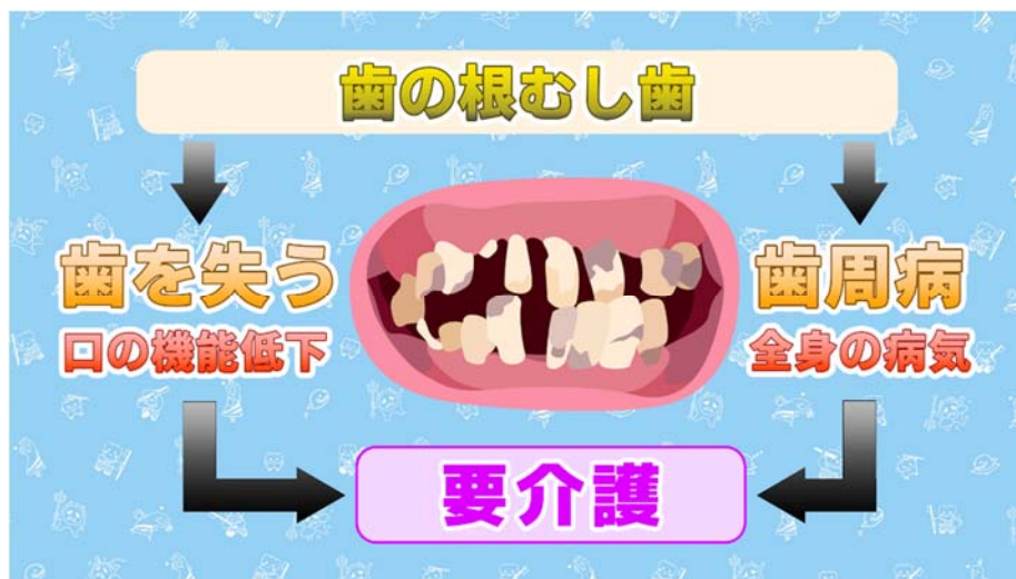
歯の根むし歯から始まる全身の健康への影響

このほど、放っておくと複数の歯を失う原因となるだけでなく、全身の病気に関連する歯周病を引き起こし、要介護に至る危険性もある「歯の根むし歯（＝根面う蝕）」について、その予防法などを伝える新作動画『放っておくとたいへん！ 歯の根むし歯』を公開しました。